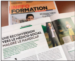
< Info Formation, février 2021

Expérimenté en 2012 en Languedoc-Roussillon, le dispositif s'est depuis déployé au niveau national, en tissant des liens pérennes avec un réseau d'employeurs ainsi qu'avec un réseau de prescripteurs.