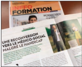
< Info Formation, février 2021

Expérimenté en 2012 en Languedoc-Roussillon, le dispositif s'est depuis déployé au niveau national, en tissant des liens pérennes avec un réseau d'employeurs ainsi qu'avec un réseau de prescripteurs.