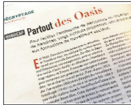
> Lien social, février 2020