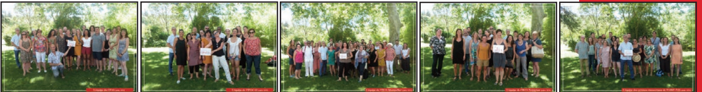
Campus de Perpignan (CRD) et de Montpellier (amphi), Photos d'équipes (IATS, IFOCAS, IRTS Montpellier, IRTS Perpignan, services transversaux, en juillet 2019)